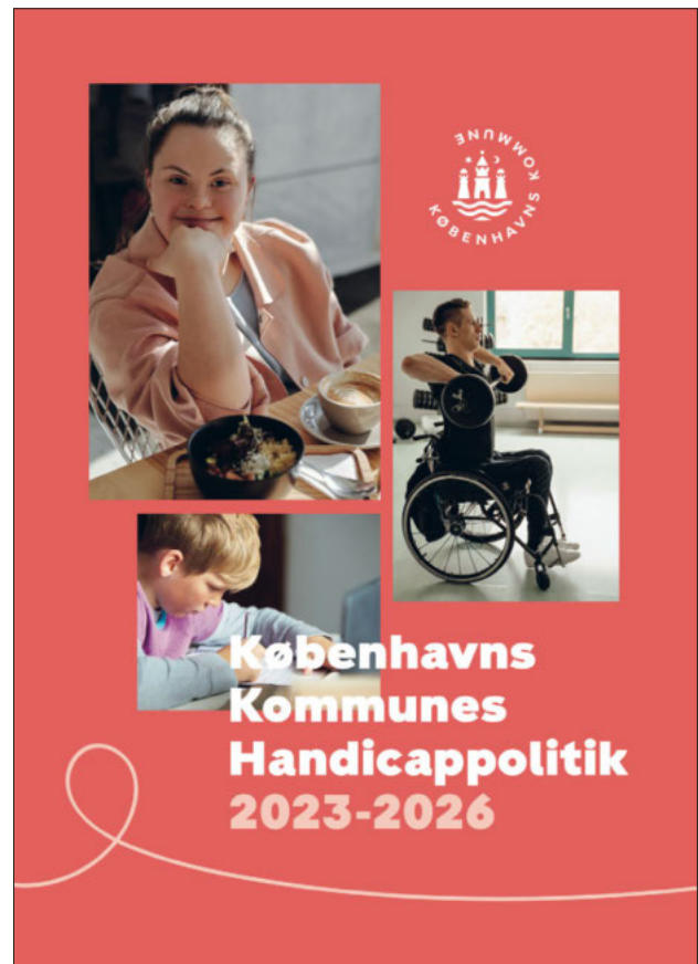
Forsiden af handicappolitikken

Handicaprådet ser frem til et produktivt, men udfordrende år, hvor der fortsat skal kæmpes for at få handicap på den politiske dagsorden.